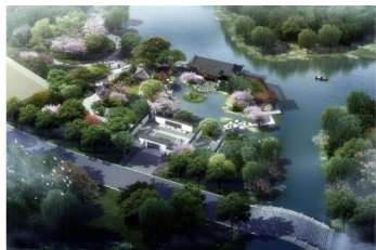
图2 “起承转合”布置形式

景观形成框景,引导游览者进入,映入眼帘的山水抽象景墙融合现代元素,强化空间视觉感受。行走于特殊文字铺装的长廊中,将游览者带入更深的园林处。在水榭的出挑平台上,欣赏云门皮影戏,借助园外风光秀丽的湖面,使游客与自然更加亲近。在园林深处,堆坡造亭的手法使整个园林形成美妙的意境。通过这种起、承、转、合的空间造园手法(图2),使游客在赏园过程中兴意盎然,孝感园营造了不同的景观空间,增加空间层次感以给人移步异景的感受。同时各个空间依托孝感的孝文化和楚文化而串联,为游客讲述了这座城市的历史脉络和新世纪的宏伟蓝图(图3)。