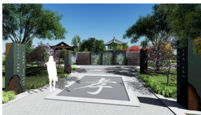
图7 “不死鸟”图腾及“三孝图”景墙

3.3.4 特殊路面铺装 云梦秦简是一部讲述秦朝法律法规、行政函牍、医学文章以及关于吉凶时辰的占书,常被用于研究中国书法以及秦朝的政治、经济、文化、医学和法律等方面的历史发展历程,具有十分重要的学术价值。另外将云梦秦简的样式在路面的铺装中表现出来,在碎石中埋入大块枕木条形成竹简,上面临摹雕刻出秦简相关的文字,使得孝文化元素更活灵活现地在孝文化主题园林景观中表现出来,营造出浓郁的孝文化氛围。