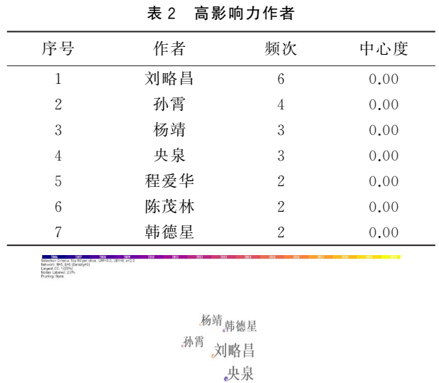
图 3 高产作者的可视化图谱

其五,探讨梭罗的创作风格:杨靖从浪漫以及科学的源流分析了梭罗创作后期的风格转变,认为 1850s 后梭罗的创作风格由自然书写和社会观察转变为更加关注田野观察和动植物的观察。毛亚旭分析了《瓦尔登湖》中梭罗的语言特色:多运用口语化以及幽默的语言。何云燕分析了梭罗散文文体形成的原因,认为梭罗散文文体的形成不仅反映了西方散文创作的传统特色,而且反映了美国当时的历史背景和时代要求。