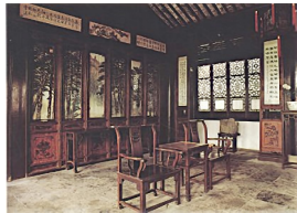
图 5 苏州网师园看松读画轩内的榻扇

2) 罩 罩起初是为了张挂帷帐而产生的辅助部件,随后逐渐衍化为一种独立的空间分隔形式和装饰要素。是清代民居厅堂中颇为重要和流行的设施,其形式如落地罩、花罩、栏杆罩等是比较常见的