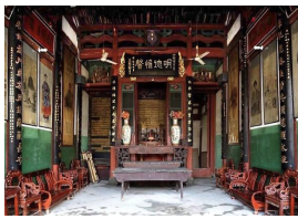
图1 闽清县坂东镇四乐轩厅堂

清代厅堂的类型,因其功能不同主要分为两类:正规礼仪厅堂、日常起居厅堂。清代的正规礼仪厅堂的空间布局均位于宅院南北中轴线上呈对称形式布置。礼仪厅堂内部的中心区也位于建筑中轴线上,体现出庄重、规整、严格的封建宗法伦理气氛。礼仪厅堂区别于日常起居厅堂的功能在于祭祀,祖宗牌位的设置在其室内陈设中是必不可少的。设置方式一般是在礼仪厅堂的北部屏壁上设一神龛,内部摆放其家族祖先的牌位或祖像。龛门平时多呈关闭状态,祭祀时才敞开(图1)。