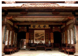
图 6 安徽黟县承志堂

4) 太师壁 太师壁多用于南方民居的厅堂之中,在厅堂后壁中央做出木雕或木棂窗,也有做成板壁在其上悬挂字画者,太师壁前设条案及八仙桌和太师椅。而于壁两侧各有一出入口,可通往厅堂后间或楼梯间(图 6)。这种陈设方式已经成为清代南方民居厅堂的特定模式。