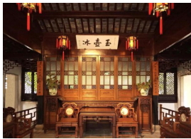
图2 拙政园枇杷园内玉壶冰

日常起居功能的厅堂,主要供给家庭内部成员使用,一般以实用功能为主,相较于礼仪厅堂,更为随意和自由一些。在布局上仍旧采用中轴对称形式,其正中中心区的墙上一般设有屏风、榻扇或悬挂字画的板壁。人们活动区域的设计和陈设主要由对椅、方桌、条案、花几、挂屏等组成。日常起居厅堂中的布局陈设更为活泼,自由,其主人的兴趣品味往往都能反映其中(图2)。