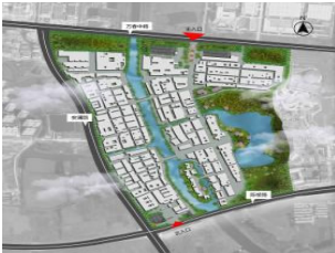
图 2 鸠兹古镇平面图

古文记载:芜湖扼长江之要冲,东临苏沪,西接湘鄂,南通浙赣,北达中原,舟车四通八达,为商贾抢滩云集之地。芜湖作为徽文化代表地区之一,在元代已成为重要商埠,到了清代商贾云集成为商业中心,其中扁担河是芜湖重要商业交通运输港口。该项目鸠兹古镇就位于芜湖市扁担河沿岸,占地面积约 1100 亩,总建筑面积约 40 万 m 2 ,整个古镇南北长 1200 m,东西宽 500 m(图 2)。场地现状拥有天然水资源优势,存有多处历史遗留名人故居,在不拆改和保护前提下,新建大量具有特色功能的徽派建筑,形成统一的整体风格。本次项目设计目标是将鸠兹古镇打造成中国首个以徽文化为主题,汇集文、旅、产、学、研为一体的文旅特色小镇(图 3)。