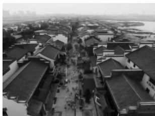
图3 鸿兹古镇鸟瞰图

形成串联式组团脉络,同时使得整个古镇的轴线脉络引导更加清晰。徽派建筑自身的聚落式空间符号,建筑群体密度较大,因此带状布局能更好的将整个古镇建筑都统一集中一起,形成水融共生的发展脉络。