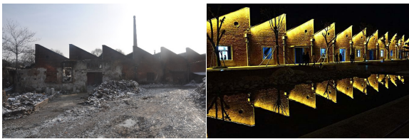
图 6 厂房立面改造前后对比

针对旧厂区内代表性建筑的立面特征,该方案中沿用了旧建用材习惯,利用文保试剂灵活处理现状立面,完整其原有风貌形态(图 6)。另将部分突出平面而表现于立面中的原有生产设备予以保留,使立面更具完整、和谐。