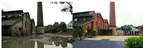
图 3 博物馆改造前后对比