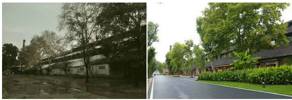
图 4 道路系统改造前后对比

于旧厂区平面构成状态下,该方案针对其中代表性建筑进行专项分析及调查,据其不同空间特征及风貌特色,灵活制定改造方案,例如,针对具有大跨空间的车间厂房,提出展览类的改造思路,而针对平面独特的锯齿形建筑,则提出了灵活分隔布局,构