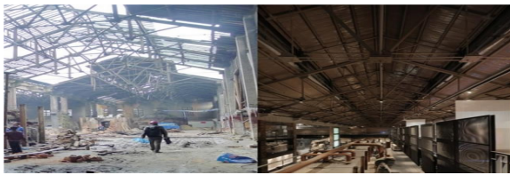
图 5 厂房桁架改造前后对比

针对旧厂区内代表性建筑的结构特征,该方案将厂区内所常见的人字架结构形式进行了符号提炼,将其作为工业景观的重要元素予以展现。但为了满足使用要求,针对该种结构形式进行了用材上的替代,即以钢构架替代传统木桁架(图 5)。