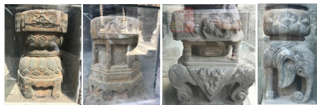
图6 康氏庄园内部分柱础

庄园内的柱础多是须弥座的复合式柱础,是庄园内最精美的砖雕之一(图6)。栈房区的柱础雕饰分两类,一是须弥座上仰覆莲花束腰,上枋为四边形且四个面雕饰梅、兰、竹、菊等植物。另一类是八边形基座,束腰八个面雕饰“卍”字纹并用立柱分隔,上枋四面雕饰动植物纹样,动物类有麒麟、虎、鹿等,植物类是“岁寒三友”或“四君子”。虎和狮都是神圣的瑞兽,有驱邪避灾的作用。“卍”字纹是佛教标志,寓意万德吉祥,常组成连片“万字不到头”的座底纹。“梅兰竹菊”四种花卉为“四君子”,是古代文人最喜欢的绘画题材。因为这四种植物身都有优秀而独特的品质,用来象征人。梅,迎风博雪,象征着刻苦耐劳,自强不息的精神;兰,深谷香远,象征圣洁,高雅;竹,可弯而不可折,象征坚韧不拔;菊,丽而不娇,象征坚韧大度。这些植物内在的精神早已成为古代人们心中的寄托和象征,用在建筑装饰同样是对自身和后代的榜样和目标 [3] 。