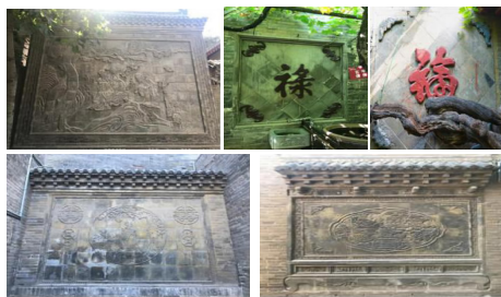
图8 康氏庄园内影壁

南大院有山墙式影壁两例,其一中间为圆构图的雕饰,名为丹凤朝阳图,寓意为贤才遇到了好时机,前途一片光明。两边各为两只倒挂的蝙蝠吊一串铜钱,取其谐音则是“福到眼前”。另一座中间为牡丹和花瓶雕饰,四角为四只蝙蝠。牡丹象征“富贵”,花瓶则为“平安”,寓意“平安富贵”。