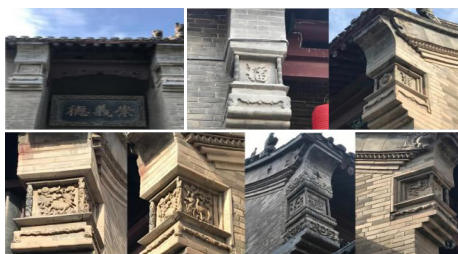
图4 康氏庄园内建筑墁头

南院的墁头上出现了“麒麟望日”和骏马脚踏祥云纹样,麒麟和龙、凤都是我国古代象征吉祥的瑞兽,随着封建社会的发展逐渐被敬为神兽。麒麟也是豫西地区常用的纹样,而“麒麟望日”是将太阳光辉比喻财富,象征康家生意兴隆,财富犹如阳光源源不断。另层寓意是期望康家人才辈出,麒麟可带贤者为官,节节高升。因此“麒麟望日”纹样则祈盼天官赐福,升官发财的寓意。而骏马脚踏祥云有平步青云之意,寓意康家人事业兴旺,财运和功名腾达。