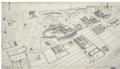
图 1 康氏庄园分布

表性的明清时期民居建筑。其占地 64 300 m 2 ,是一座集古代民居、官宦宅邸、庙宇宗祠、商栈作坊、学馆窑洞、防御军事为一体的堡垒式建筑。整个庄园在地理位置上,背依邙山、面邻洛河、北近黄河、南凭黑石关、形成依山就势的庞大建筑体系,以“依山箍窑洞,临街筑楼房,濒河建码头,据险垒寨墙”的灵活布局为特点,形成了整个功能齐全,形式不同,风格各异的建筑群 [1] (图 1)。康氏庄园是豫西地区民居的典范,庄园内从建筑到家具的装饰都很精美。石雕主要分布在柱础、门枕石、碑楼等建筑上,砖雕主要分布在墀头、门额、脊饰等方面,木雕分布在门窗、斗拱、窗棂、挂落、垂花门楼、桌椅、床框等。庄园内这些装饰所具有的寓意,表达着康氏族人在历史变迁中对未来生活的美好期盼,也体现明清时期人们思想的物化表象。