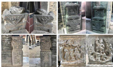
图7 康氏庄园内门枕石

花门下有一对须弥座门枕石满布雕饰,最上方盘卧狮子,盘卧的狮子有三种寓意:一是代表康家生活富足,狮子都可以吃饱。二是康家的防御设施完善,三道防线将康家保卫的固若金汤,连狮子都可高枕无忧。三是教育子孙为人做事内敛,不张扬跋扈。其它四面为景物场景雕塑:左边迎面是一学生有问题不解,夜里向老师叩门求教,名为深夜求师图;左侧面的为两位妇人,一位送食物给另一位,名曰妯娌和睦图;右面迎面为敬老图,一位手扶罗圈椅的老人欲要起身,青年忙去搀扶。侧面画面为宾客宴饮图,寓意为读书知礼。与迎面的敬老图合称敬老爱幼图。康家有“万般皆下品,唯有读书高”的家训,门枕石上的深夜求师图是告诫后代子孙能够刻苦读书。而妯娌和睦图则蕴含家和万事兴的思想,这对门枕石承载了康家人对子孙后代传承优秀品质的期望。