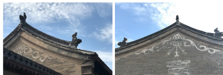
图5 康氏庄园内山花与博风板

康氏庄园内的建筑,博风板是方形的砖砌在墙的顶端,形成人字形的博风板,两端博风头用砖雕龙头镇宅避邪(图5)。人字形最顶端位置是莲花纹脊花,其它屋顶有太极八卦纹脊花,八卦纹在古代也是常用的吉祥图案,它有一种对立统一的形式美,用在脊花上的寓意是除凶避灾。博风板以下的位置用白色的泥塑勾勒出山花。画的是一个倒置宝瓶,瓶中倒插三把戟,花瓶周围是卷草纹装饰,空白的山墙被勾勒出无限的生机。此种图案名为“瓶升三戟”,谐音即平升三级。“级”代表的是古代官员的品级,平升三级,期望康家在职的官员能够官运亨通,连升三级的寓意。