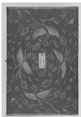
图4 密陀彩绘箱(第14号盖表)

2.1.3 折枝纹 顾名思义,折枝纹(图5)的纹饰仿佛从枝头折下的植物或似单独生长的花草,形态大都比较写实,纤细繁缛、精细绚丽。折枝纹的形态多种多样,大多无内在联系,而是各以其侧倚的姿态显示出百花繁茂、各有其美的自然天性。根据正仓院所藏的唐式彩绘箱的装饰纹饰类别,可将其所含的