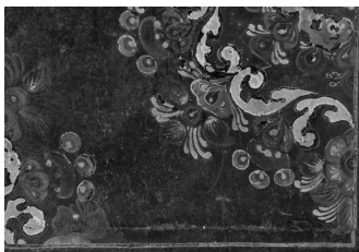
图1 密陀彩绘箱(第13号 局部)