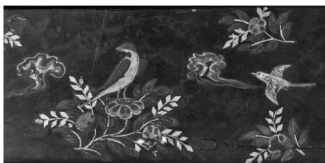
图7 密陀彩绘箱(第15号 局部)

2.1.5 动物纹 正仓院藏唐式彩绘箱盒上的动物纹饰(图7)除延续传统蕴涵吉祥、神秘寓意的凤鸟、飞龙等瑞兽纹外,还大量应用极具生活气息的写实动物纹饰,如飞鸟、燕子、大雁、蝴蝶,极富生活情趣。其表现方式或与折枝纹组合,反映王公贵戚赋闲生活的恬静场面;或单个穿插在各种植物团窠纹间展示生命的活力;或藏于卷云纹间,表现对仙境的向往。前述绘有忍冬纹的密陀绘漆箱(图4、图8),箱盒上盖绘有忍冬纹和四只围绕中心题笺回翔的凤鸟,箱体立壁以及壶门脚绘有忍冬纹及怪兽头纹。作为主体的动物纹饰笔触与忍冬纹的相互协调,显示出飞扬流动、激昂圆满的韵律感。