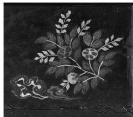
图5 密陀彩绘箱(第15号 局部)

各种折枝按特点分为:折枝花草纹、折枝莲纹、折枝花鸟纹、折枝叶纹等。在同一平面上均衡散列的折枝与间或穿插的飞鸟或蝴蝶燕子共同营造出赋闲、优美的田园野趣。