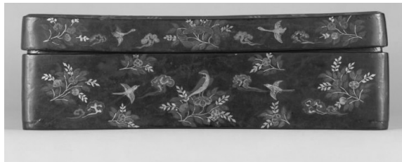
图 10 密陀彩绘箱(第 15 号 短侧面)

散沙,又要达到形散而神不散的视觉效果。如图 10 中箱盒的侧面条状部位装饰纹样,采用了散点式布局方式,这种构图形式看似简单但又保持重心稳定,带来一种惬意休闲的视觉感受。