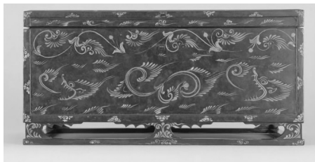
图 8 密陀彩绘箱(第 14 号 长侧面)