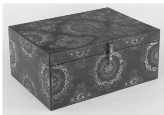
图2 密陀彩绘箱(第13号 斜全姿)

2.1.2 忍冬纹 正仓院所藏的唐式彩绘箱盒中,有一件密陀油彩绘漆箱的审美情趣极高,此箱盒摒弃了复杂的纹饰与色彩堆砌,而是运用忍冬纹的飞卷动势(图3、图4)创造出几何式的美感,以黄色作为纹样主色,间或在纹饰笔触末端补缀赤色,使二色自然过渡。忍冬又名金银花,以蔓生、越冬不死等为特点,常被佛教象征为轮回不止、变化无常 [3] ,因此在唐代被广泛施用于装饰纹样之中。正仓院所藏的唐式彩绘箱盒纹饰中的忍冬纹多数为三曲至五曲的半片叶,少许或为两叶对卷,或单叶出现。