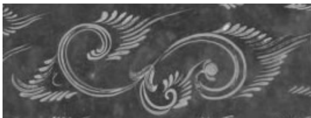
图3 密陀彩绘箱(第14号 局部)

2.1.2 忍冬纹 正仓院所藏的唐式彩绘箱盒中,有一件密陀油彩绘漆箱的审美情趣极高,此箱盒摒弃了复杂的纹饰与色彩堆砌,而是运用忍冬纹的飞卷动势(图3、图4)创造出几何式的美感,以黄色作为纹样主色,间或在纹饰笔触末端补缀赤色,使二色自然过渡。忍冬又名金银花,以蔓生、越冬不死等为特点,常被佛教象征为轮回不止、变化无常 [3] ,因此在唐代被广泛施用于装饰纹样之中。正仓院所藏的唐式彩绘箱盒纹饰中的忍冬纹多数为三曲至五曲的半片叶,少许或为两叶对卷,或单叶出现。