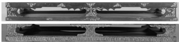
图 11 彩绘箱脚部(角隅边缘彩绘举例)

2.2.5 对称式 角隅边缘的元素组合一般遵循对称的方法(图 11),这便是局部和整体的对立与统一,虽然在局部是不断地重复或者是单独的图形,但是放在整体,从宏观的角度就是统一,因此角隅边缘的装饰纹样特征可以简洁的概括为对称统一。